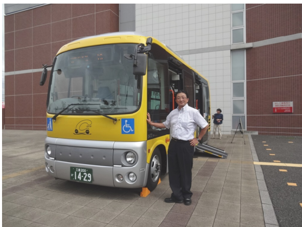
市役所前で新車両のお披露目

走り出してから15年を超えたCバス、住民におなじみとなった黄色いバスが、この10月から新しい車両になります。