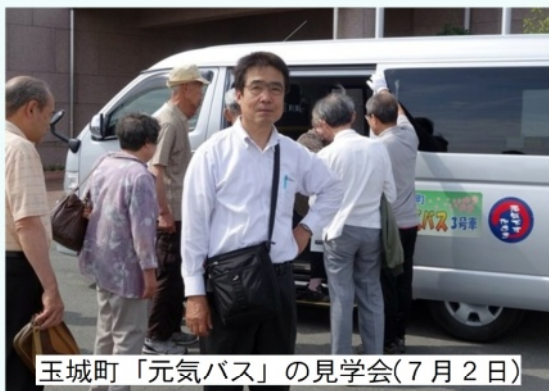
玉城町「元気バス」の見学会(7月2日)