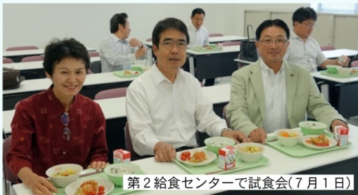
第2給食センターで試食会(7月1日)

5月から中学校給食が本格実施されました。稲生町の第2給食センターから毎日、あたたかい給食が市内10中学校に運ばれます。いろいろトラブルもありますが、現場の声、生徒の声をきき問題を解決しながら日々の業務を進めています。