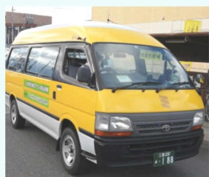
一の宮地区を走る乗り合いワゴン車