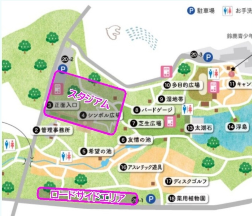
鈴鹿青少年の森、パークPFIとサッカースタジアム計画のイメージ図

鈴鹿サーキットの西側に1972年にオープン、落ち着いた緑の空間が50年間市民に親しまれている県営公園「鈴鹿青少年の森」。6月の県議会で、今後19年間民間事業者を「指定管理者」とする条例改定が議決されました。公園内にある青少年センターと一体に、民間業者による管理運営が行われることとなります。